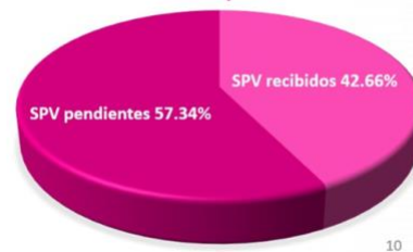
Avance de recepción SPV

El 20 de mayo del presente año, se compartió entre las personas integrantes de esta Comisión el Informe Avance envío PEP y retorno de los Sobres Postal Voto con corte al 17 de mayo, puede consultar el documento dando click a la siguiente imagen: