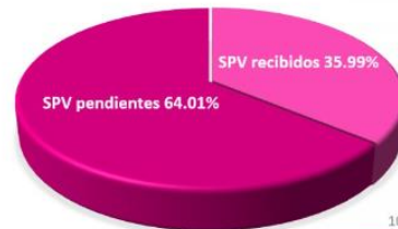
Avance de recepción SPV

Igualmente en fecha 15 de mayo se compartió el avance de recepción de Sobres Postales Votos