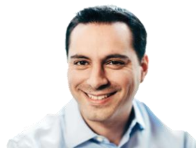
10. PAN-MOV. CIUD. Mauricio Vila Dosal